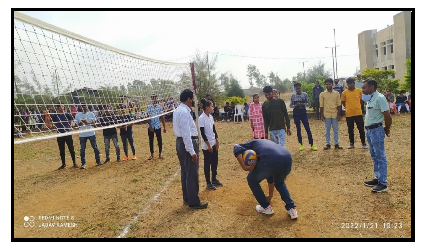
Date: 21/01/2022 Photographs: